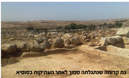
גת קדומה שנתגלתה סמוך לאתר העתיקות בסוסיא

לקראת סוף ימיו מברך יעקב את השבטים, כל שבט על פי מעלתו ודרגתו. יהודה זוכה לברכת ההנהגה ולברכה של שפע חומרי בין ובחלב. נחלת יהודה - נחלה רבגונית היא מהבחינה הנופית: ליהודה חלקים בשפלה, בהר, במדבר ובנגב. בברכתו ליהודה נותן יעקב אבינו דגש מיוחד על היין והחלב. יש לציין שיש המפרשים שהברכה "וְלֶבֶן-שְׁנַיִם מִחֶלֶב" עניינה בין לבן שהיה מובחר מאוד בימי קדם. גידול כרמי יין ועדרי צאן הינן שתי פעולות חקלאיות מנוגדות לכאורה אחת לשנייה, שתי תפיסות עולם עומדות בייצור היין ובהפקת החלב: אנשי היין הם הכורמים, אנשי הקבע הגרים בארץ הנושבת, הנוטעים כרמיהם ומקובעים למקומם. לעומתם אנשי החלב (וכמובן אין כאן הכוונה לתנובה...), הם רועי הצאן המדברים צאנם במדבריות, אלו הנוודים עם צאנם בשטחי המרעה ואינם מחוברים לשטח מסוים. שתי האוכלוסיות הללו נפגשות בנחלת יהודה בקו התפר שבין ההר (הארץ הנושבת) למדבר (ארץ הרועים), באזור המכונה ספר המדבר. בעת העתיקה לרועי הצאן ולאיכרים היו מאבקים רבים בתפיסת השטח: האיכר - כורם רצה לטעת הרבה כרמים ולהכשיר אדמות לצורך זה, מאידך רועה הצאן היה צריך את אותן קרקעות להדברת צאנו, וכמובן שהשוני בין התפיסות ובין המשימות גרם לחיכוכים רבים. בנוסף, לכל אזור יש "שטח נשיאה" משלו. "שטח נשיאה" הינו מדד המציין את מספר הפרטים של מין מסוים, היכולים להתקיים לאורך זמן בסביבה