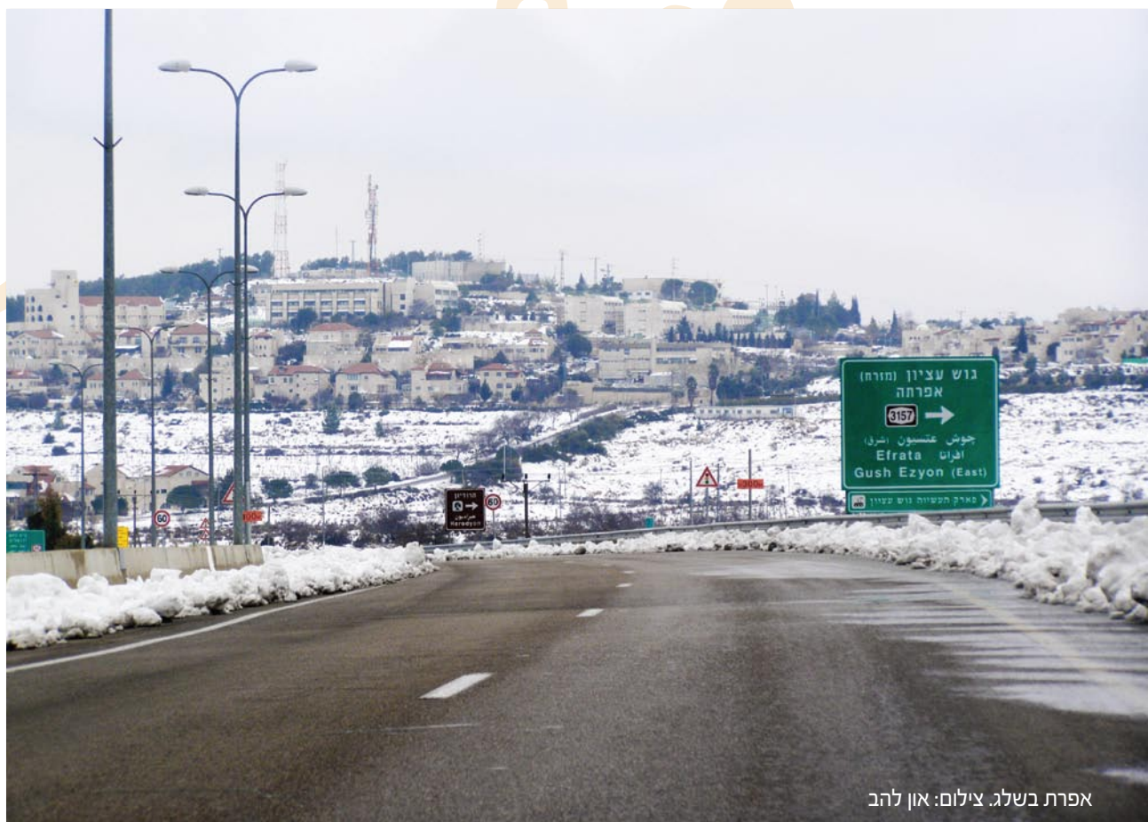
אפרת בשלג.

יום שלישי בבוקר, ב' שבט תשנ"ה, 3 בינואר 1995, נסע אחימן לפגישה עם שבס. השניים סיכמו שהעבודה בגבעת-הזית תתחיל מיידית, אחרי שיגיעו מספר אישורים מהמינהל האזרחי. באותו יום התכנס צוות השרים לעניין הבנייה בגבעת-הזית. הסיכום היה חיובי: הבנייה בגבעת-הזית תימשך. אבל בלי "עז" אי-אפשר. סעיף 7 בהחלטה קבע, כי "הסכם הפיתוח בין הממונה לבין העמותה לגבי השטח הידוע כ"גבעת-התמר" שנחתם ביום 24 באוגוסט 93 יבוטל על ידי הממונה". היה זה תקדים חמור, של הפרת חוזה בידי הממשלה באופן פומבי, בגלל כניעה