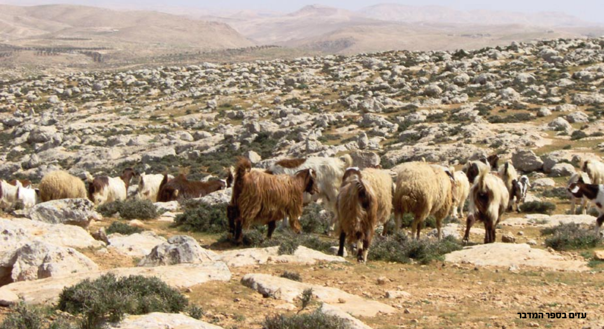
עזים בספר המדבר