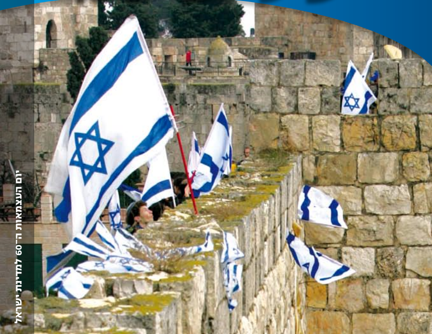
יום העצמאות ה-60 למדינת ישראל