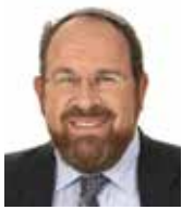
הרב שלמה קמחי מייסד ישיבת בני עקיבא אורות יהודה