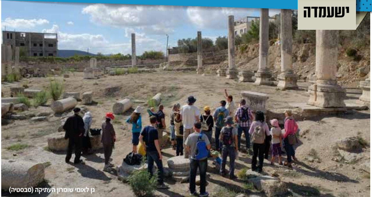
גן לאומי שומרון העתיקה (סבסטיה)