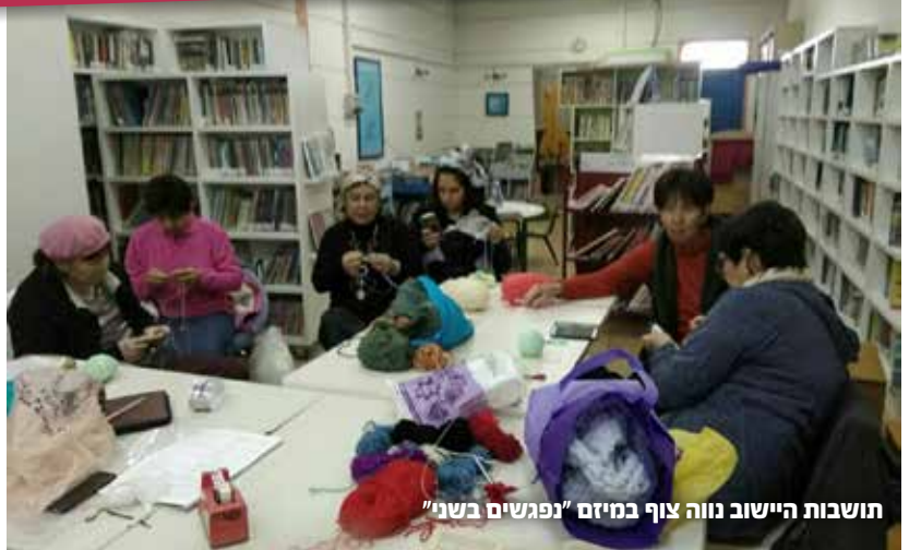
תושבות היישוב נווה צוף במיזם "נפגשים בשני"

"הייתי רוצה לראות איך הנוער יותר משתלב בפרויקט ני"ל"י נגרים, שיהיה דור המשך, וגם לראות איך אנחנו מצליחים להדביק בזה יישובים שכנים, שיהיה פרויקט חוצה בנימין. אם בעוד שנה יהיו גם 'עפרה נגרים' או 'שילה נגרים', או שאנחנו נזמין את דולב אלינו או נבוא אליהם ונעשה איזה פרויקט משותף, זה יהיה נהדר."