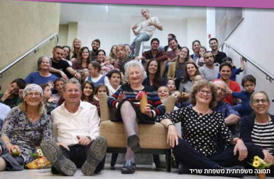
תמונה משפחתית משפחת שריד