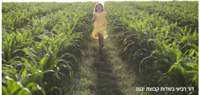
דור רביעי בשדות קבוצת יבנה

מכאן הכל זרם בטבעיות, ובאופן מופלא נוצר החיבור בין סבא, שנפטר לפני 13 שנים, לבין הנינים שלו שלא זכו להכיר אותו, אך כל כך מעריצים אותו, הולכים בדרכו ומקיימים את הצוואה שלו - דעו כי משריד נבניתם.