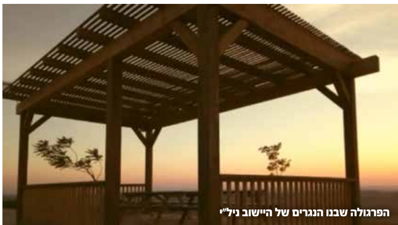
הפרגולה שבנו הנגרים של היישוב ני"ל"י

"אחד הפרויקטים היפים זו בניית פרגולה גדולה שפונה מערבה, שעשינו בה עמדת תצפית וכרטיס טווחים, והיום היא תחנה קבועה לאוטובוסים של 'תגלית', סיורים של מדריכי טיולים, ומקום מנוחה לכל החיילים בגזרה שעוצרים לקנות במכולת. כל פעם שאתה עובר שם ורואה את הקהילה ואנשים