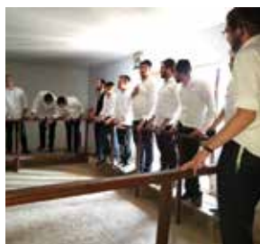
שישי | 12 באפריל

תפילה וסיוור ביריחו / ז' בניסן 12 באפריל מוזמנים להצטרף לעמותת "תרבות ומורשת יריחו" לתפילת שחרית בבית הכנסת "שלום על ישראל" ולסיוור בתל יריחו, מעיין אלישע ובית הכנסת נערן. אוטובוסים יוצאים מירושלים בשעה 6:00 וממושב נעמה בבקעת הירדן ב-6:50. מחיר: 50 ש. לפרטים והרשמה: 052-8699300