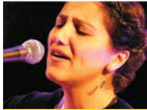
חמישי | 14 במרץ