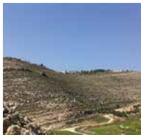
שישי | 8 במרץ

בהצגה זוגית מוסיקלית, מרגשת עד דמעות ומלאת הומור, הזוג יעל וליאור רבינוביץ חושפים דרך סיפורם האישי את הדרך בכדי למצוא זוגיות. המופע עוסק בערכים כמו ראיית הטוב, שבירת סטיגמות ובעיקר תקווה ואמונה במציאות שנראית חסרת מוצא. בשעה: 20:30 במתנ"ס אפרת בגפן. מחיר: 35 ש. לפרטים וכרטיסים: 02-9932936