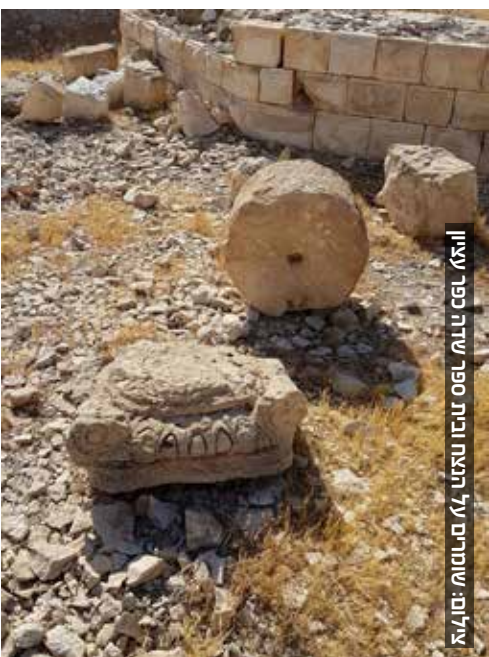
איליא: ספר ידוע מראש על תוכנית השוד: איליא