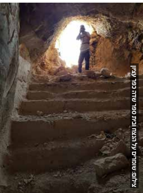
איליא: ספר ידוע מראש על תוכנית השוד: איליא