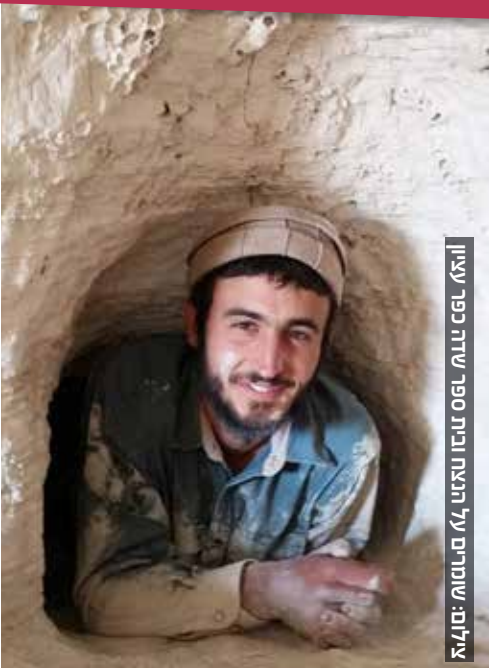
איליא: ספר ידוע מראש על תוכנית השוד: איליא