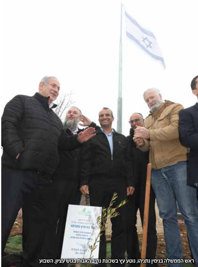
ראש הממשלה בנימין נתניהו, נוסע עץ בשכונת נתיב האבות בגוש עציון, השבוע