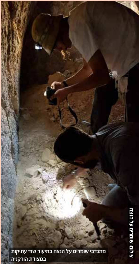
עילום: שומרים על הנצח