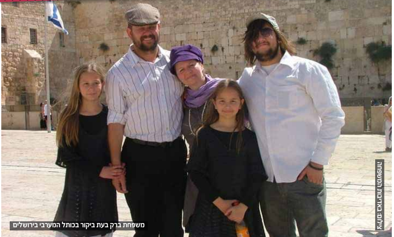
משפחת ברק בעת ביקור בכותל המערבי בירושלים