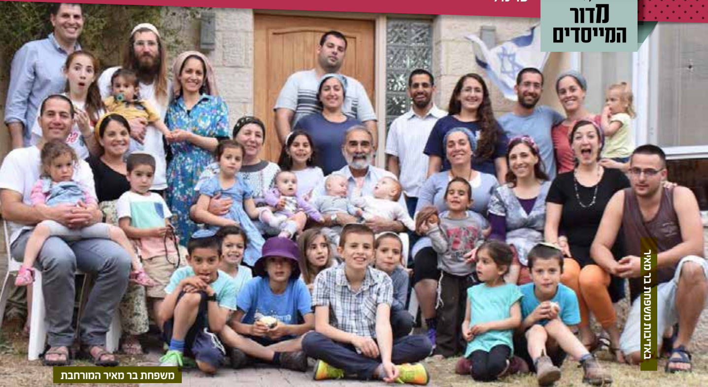
משפחת בר מאיר המורחבת