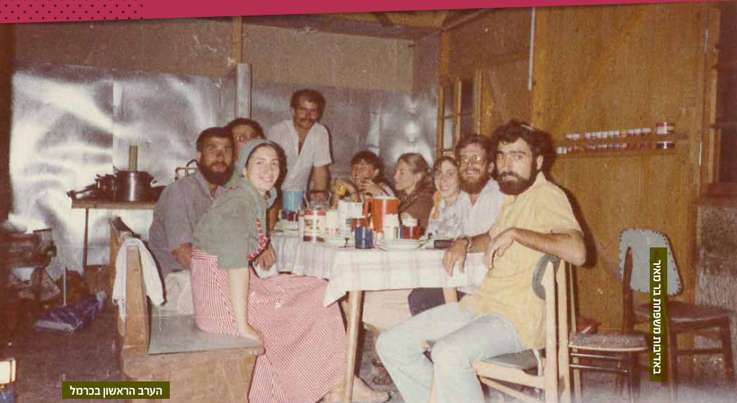
לאום כל תשט"ט טוהר יואל