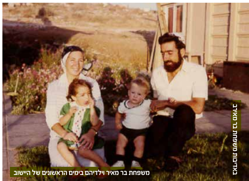
לאום כל תשט"ט טוהר יואל

ככלל יש לנו זיכרונות טובים מאז בעיקר הודות לשותפות ולביחד. היינו מוכנים לקשיים: חשמל היה רק מגנטור. למים החמים היה מתקן