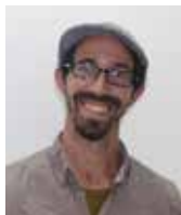
הרב זוד גודינגר