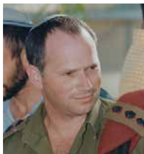
חמישי | 29 בנובמבר

מצדיעים לגיבורים שלנו - הצגה: חוזר הביתה עם אסי צובל. סיפורו של אמן ולוחם המגייס את הרגישות, התקווה וההבת החיים שבו כדי להצליח ולנצח את המלחמה גם אחרי שהיא נגמרה. ההצגה מבוססת על סיפור אמיתי. לאחר ההצגה יתקיים פאנל בהשתתפות מטפלי מרכז חוסן עציון. מחיר: 10 ₪. כניסה ללא תשלום לאנשי כוחות הביטחון ומתנדבי החירום באפרת. לפרטים: 02-9932936