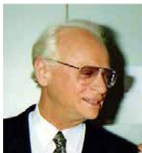
שלישי | 20 בנובמבר

ערב חד-פעמי מצחיק, מרגש ומעניין, על חייו ועל יצירתו של אפרים קישון - גדול יוצרי ההומור בישראל מסופר בהומור קישוני אינטליגנטי על ידי בנו הבכור - ד"ר רפי קישון. בשילוב קטעים נהדרים ומצחיקים מסרטיו הידועים. בשעה 20:30 ב'פת במלח'. מחיר: 10 ש"ח. לפרטים והזמנות: 02-9932936