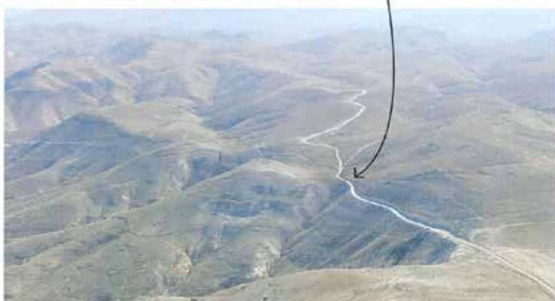
השתלטות חקלאית ופריצת דרכים במסדרון הישראלי המיועד לכביש גוש עציין - ים המלח