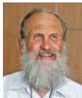
רב משה גנץ ר"מ בישיבת שעלבים