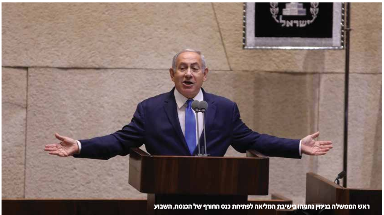
ראש הממשלה בנימין נתניהו בישיבת המליאה לפתיחת כנס החורף של הכנסת, השבוע

אנו נמצאים בתקופה טובה גם בכל הקשור ליחסי החוץ של מדינת ישראל. ראש הממשלה התפאר בקשרים עם המעצמות רוסיה וארה"ב ואמר: "הידקנו את יחסינו עם רוסיה. סגן ראש