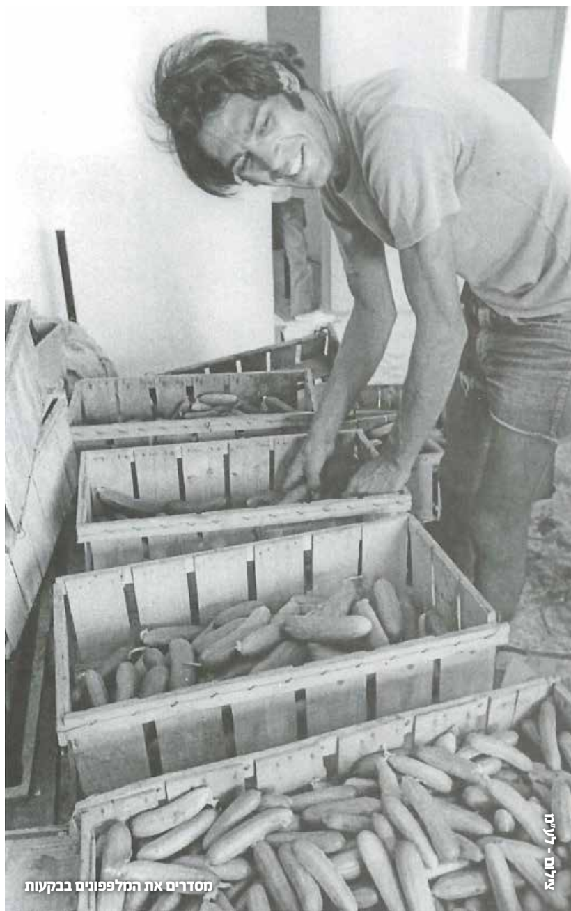
מסדרים את המלפפונים בבקעות