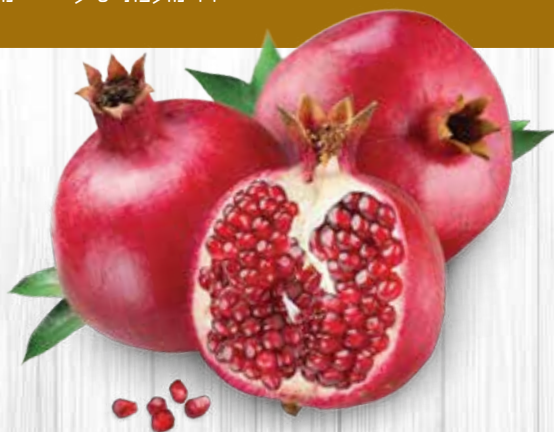
כננאל דורני יו"ר מועצת יש"ע