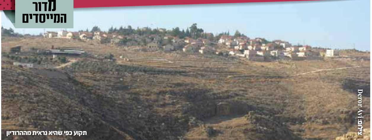
Derot Avi ילדים