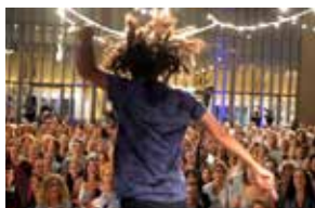
ראשון | 11 במרץ

בובי וציפצ'יק הם שני עכברים שגדלים כחברים הכי טובים, עד שבובי עובר לגור בעיר, וציפצ'יק משתקע בטבע. שני החברים, שכבר חשבו שלא ייפרדו שוב לעולם, מבינים שלא כל מה שטוב לאחד בהכרח טוב לשני, ושלכל אחד מתאים משהו אחר. בשעה 17:30 במתנ"ס. מחיר: 25 ש. לפרטים והזמנות: 02-9961666