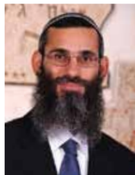
הרב שמעון ביטון