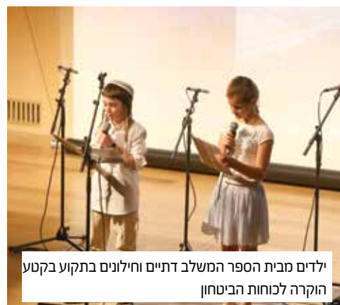
ילדים מבית הספר המשלב דתיים וחילוניים בתקוע בקטע הוקרה לכוחות הביטחון