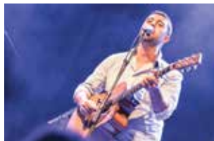
ראשון | 11 ביוני