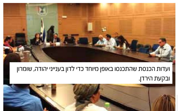
ועדות הכנסת שהתכנסו באופן מיוחד כדי לדון בענייני יהודה, שומרון ובקעת הירדן.