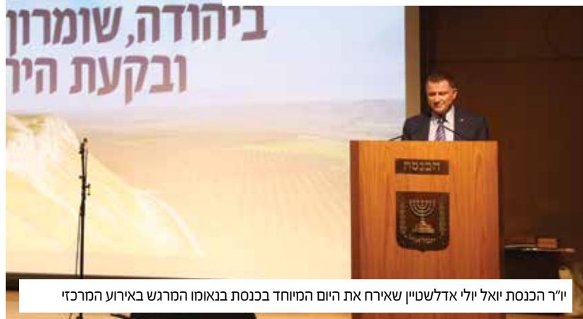
יו"ר הכנסת יואל יולי אדלשטיין שאירח את היום המיוחד בכנסת בנאומו המרגש באירוע המרכזי