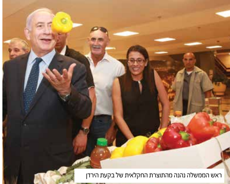
ראש הממשלה נהנה מהתוצרת החקלאית של בקעת הירדן