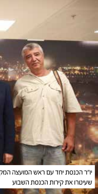
יו"ר הכנסת יחד עם ראש המועצה המקומית שיעטרו את קירות הכנסת השבוע