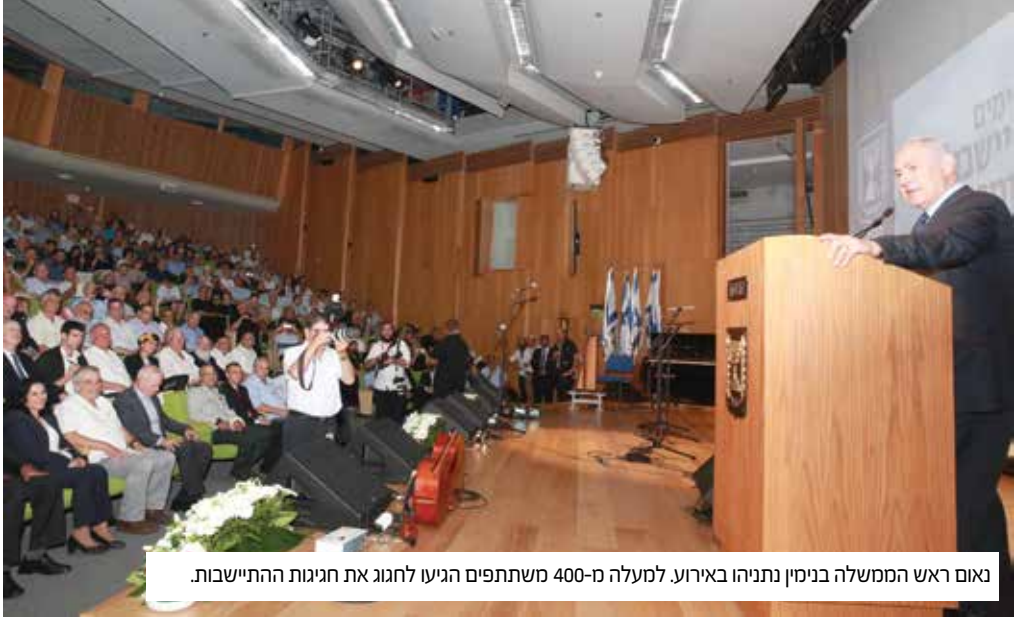
נאום ראש הממשלה בנימין נתניהו באירוע. למעלה מ-400 משתתפים הגיעו לחגוג את חגיגות ההתיישבות.