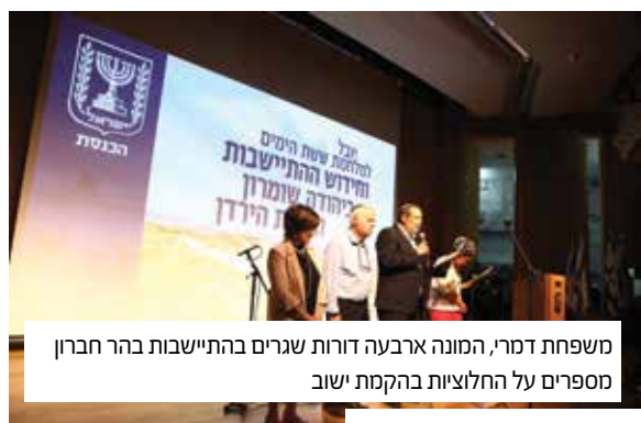
משפחת דמרי, המונה ארבעה דורות שגרים בהתיישבות בהר חברון מספרים על החלוציות בהקמת ישוב