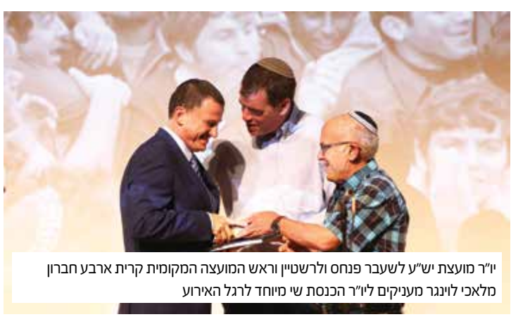
יו"ר מועצת יש"ע לשעבר פנחס ולרשטיין וראש המועצה המקומית קרית ארבע חברון מלאכי לוינגר מעניקים ליו"ר הכנסת שי מיוחד לרגל האירוע