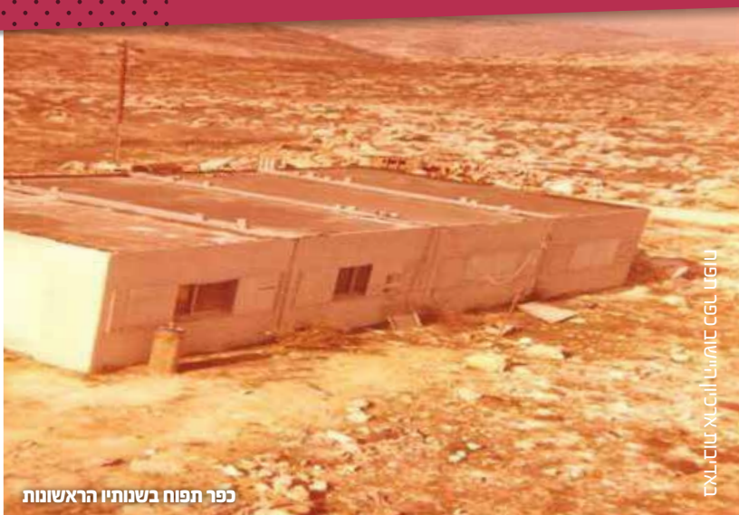
כפר תפוח בשנותיו הראשונות