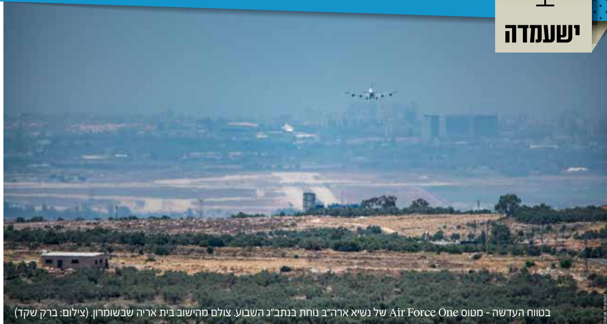
בנווה העדשה - מטוס Air Force One של נשיא ארה"ב נוחת בנתב"ג השבוע. צולם מהישוב בית אריה שבשומרון.

בידיה את האחריות לעתידה של מדינת ישראל. השריט נמצא כעת אצל ראש הממשלה בנימין נתניהו ושירי הממשלה בכל מהלך עתידי. אחרי ההתבטאויות החשובות של נשיא ארה"ב והביקור החם בארץ, זה הזמן להתקדם הלאה, להוכיח את ריבונותנו על הארץ ולבנות בכל חלקיה ללא הגבלות וחסימות.