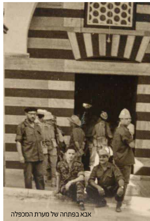
אבא בפתיחה של מערת המכפלה

כמו חשמל - אחזה התרגשות עצומה בכלום. באופן ספונטני התחלנו לשיר את "ירושלים של זהב", השיר שרק בשבועיים האחרונים שלפני המלחמה התחיל להישמע ברדיו ברחבי המדינה, וכעת הפך להימנון המלחמה... למרות מחאותיה של אימי, לקח אותי אבא - ילד בן שבע - לגג הבניין בו גרנו. משם צפיתי יחד עם אבא על מטוסי המירז' - הרכש הצרפתי האחרון שלנו, יורדים ומפציצים באזור הר הצופים ואוגוסטה ויקטוריה. אזור שנמצא לא רחוק מאיתנו, אזור בו שיירות שלנו, שהיו צריכות להגיע למובלעת האוניברסיטה העברית בהר הצופים, הותקפו וכל אנשיהן נהרגו. הסיוור הסתיים. חזרתי לחדר האפל, ואבא חזר למלחמה.