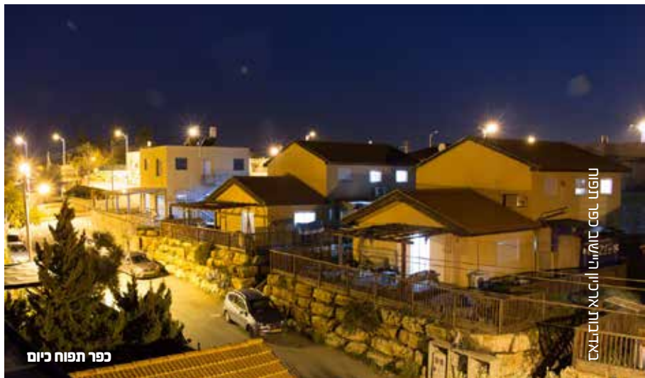
כפר תפוח כיום

מתרחבים! במשך כמעט כל העשור הראשון נשארנו בקבוצה מצומצמת של כ-30 משפחות, נוצר הווי מיוחד של קיבוץ משפחתי, רובנו בני