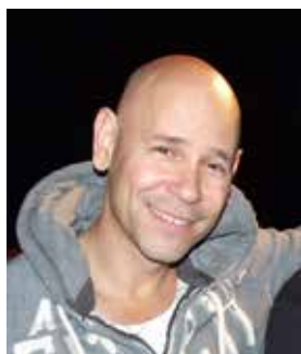
שישי | 2 ביוני