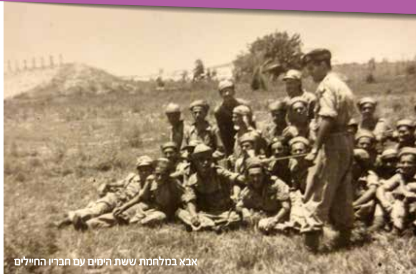
אבא במלחמת ששת הימים עם חבריו החיילים