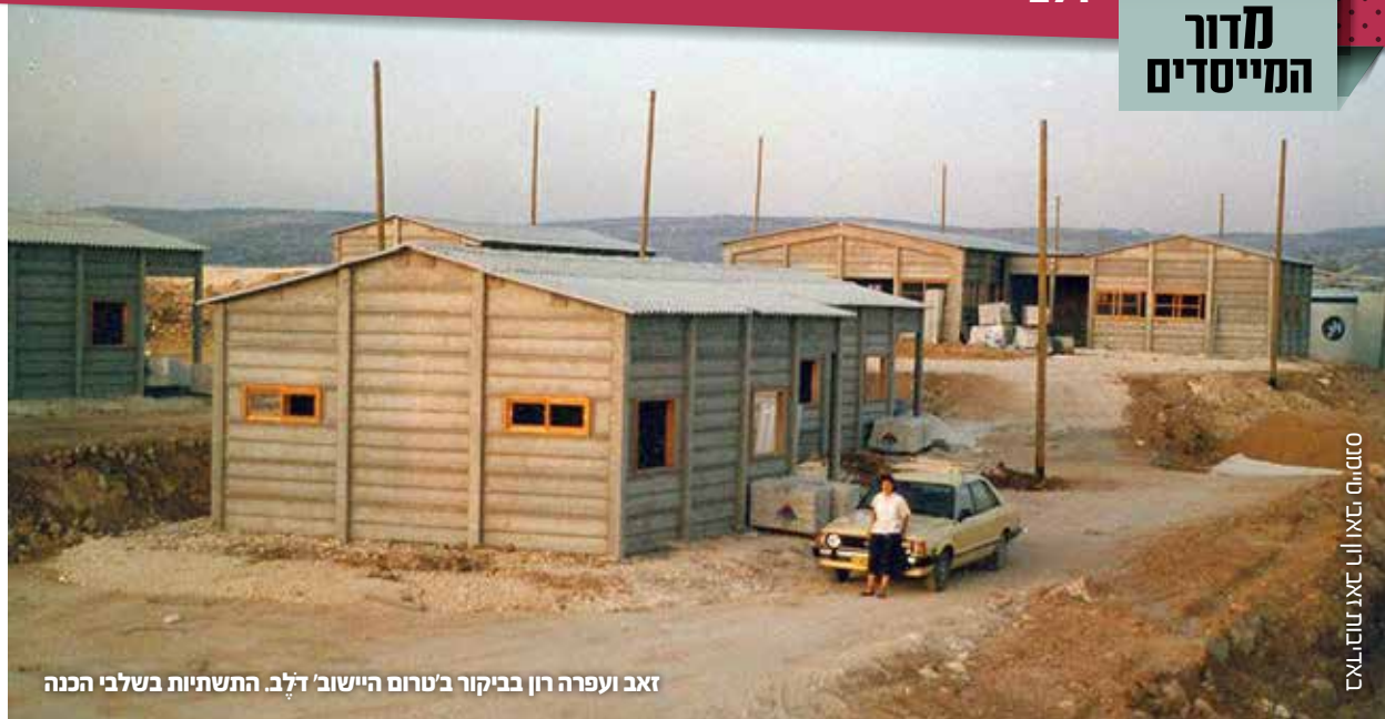
סמית, יצחק וליאורה