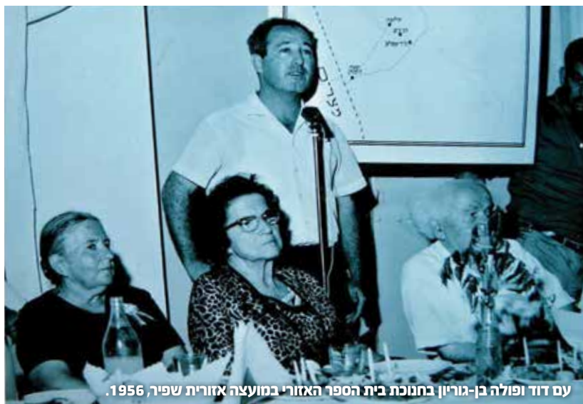
עם דוד ופולה בן-גוריון בחנוכת בית הספר האזורי במועצה אזורית שפיר, 1956.