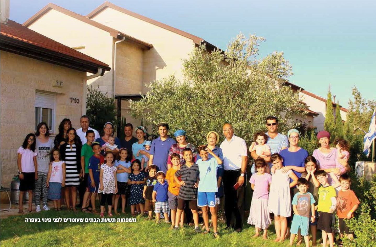
משפחות תשעת הבתים שעומדים לפני פינוי בעפרה

החוק הישראלי עדין לא חל במלואו על יהודה ושומרון ובשל כך נוצרים הרבה עיוותי דין ובעיות משפטיות. החקיקה באזור מפותלת ומסתמכת על חוקים וצווים עוד מהתקופה העותמאנית והירדנית דבר שגורם לאפליה בזכויות בסיסיות של תושבי יהודה ושומרון על פני שאר תושבי ארץ ישראל. מדינת ישראל בנתה בתים, אישרה תכניות ואנשים גרים ביישובים האלה כבר שנים רבות, ופתאום מגלים שהמדינה עשתה טעות ולא הסדירה את המקום כראוי. במצב כזה המדינה