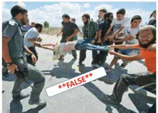
Settlers attack a Palestinian child while being observed by Israeli occupation forces

הפלשתינים מציגים: PALLYWOOD ארגון הבריאות העולמי מציג: גינוי ישראל על סמך שקרים. הפיצו. == מה בתמונה? השקר: "מתנחלים תוקפים ילד פלשתיני וכוחות צה"ל עומדים מהצד". האמת: מדובר בתמונה של גטי אימאג'ס, המתעדת את פינוי חוות גלעד בשומרון. זה רק שקר אחד מתוך מסכת של שקרים ותמונות שקריות בדו"ח הרשמי של הרש"פ. והחלטת האו"ם? היא מגנה את ישראל על "מצב הבריאות בשטחים הפלסטיניים הכבושים, כולל מזרח ירושלים והגולן הסורי הכבוש". == עוד פירוט על הדו"ח האבסורדי הזה באתר של פרספקטיבה [כדאי לעקוב אחרי הארגון החשוב הזה]: http://bit.ly/1sVuEhc == אנטישמיות גרסת 2016, בחסות האו"ם. לא מפתיע אבל חשוב להפיץ. == ישראל שלי עושים ציונות