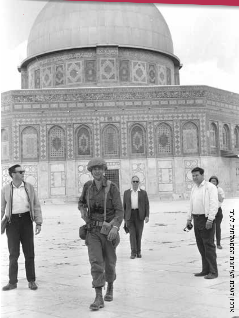
אילן לוי/המכון לאסטרטגיה