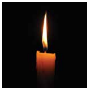
שלישי 10 במאי