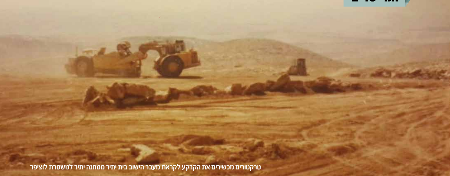
טרקטורים מכשירים את הקרקע לקראת מעבר הישוב בית יתיר ממחנה יתיר למשטרת לוציפר

ישוב, קיבלנו שטחי חקלאות בתל ערד. ביום היינו חקלאיים ובערב היינו עירוניים. בערד ערכו חברי הגרעין ישיבות בנוגע לישוב שהולך לקום: פרנסה, אופי הישוב ומה הולך להיות בהמשך. בציפייה דרוכה הם חיכו ליום בו יוכלו לקבל את מפתח הכניסה ולהתיישב. שמונה חודשים לאחר שהוקמה היאחזות, ב-10 בספטמבר 1981, חל טקס האזרחות של היאחזות כרמל.