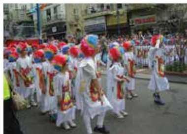
שישי 25 במרץ