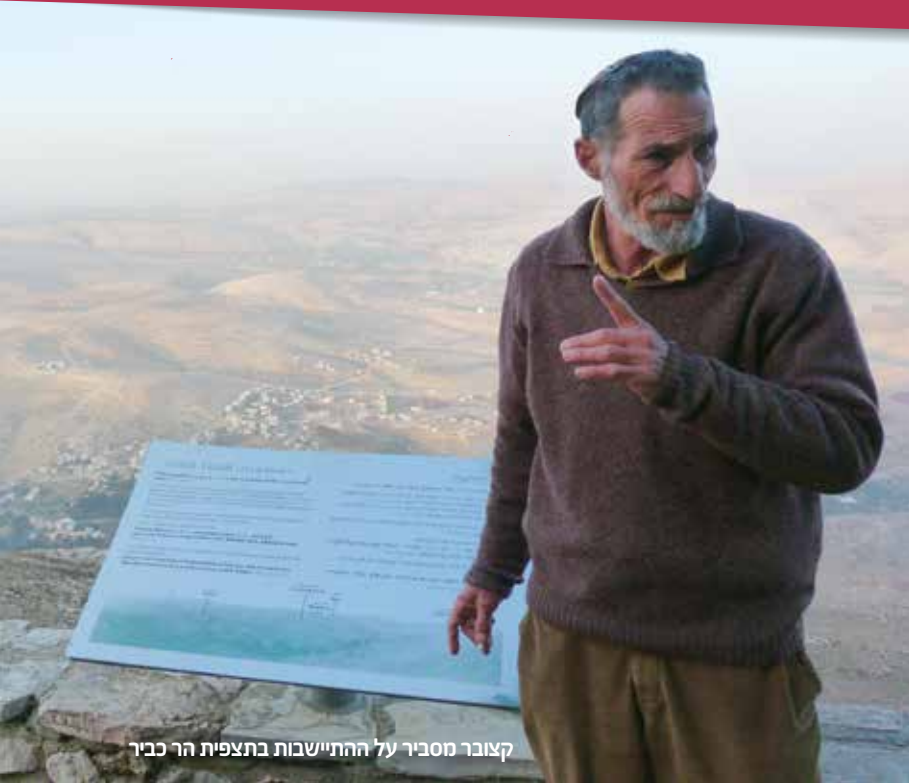
קצובר מסביר על ההתיישבות בתצפית הר כביר