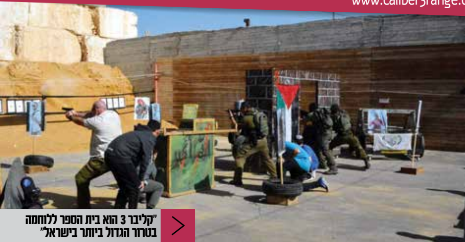
"קליבר 3 הוא בית הספר ללוחמה בטרור הגדול ביותר בישראל"

בשיתוף המרכז לטיפוח יזמות ועסקים קטנים ביהודה, שומרון והבקעה www.mati-shay.org.il