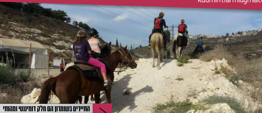
התיירים בשומרון הם חלק דומיננטי ומהותי מהימצאותנו בארץ ישראל והתיירות

ההרגשה שמלווה אותנו היא הרגשה של שליחות והודיה על שהקמנו מקום טיפולי ברמה הגבוהה ביותר, כאן אצלנו בשומרון, בארץ ישראל.