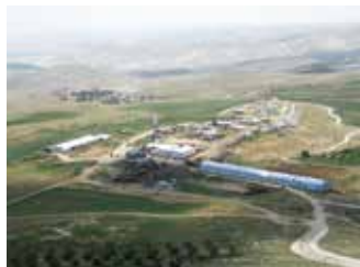
יום שישי 23 באוקטובר

מרכז מורשת מנחם בגין והיכל התרבות באריאל מזמינים אתכם הרצאה על הנשיא חיים וייצמן מפי פרופ' יוסף גורני, מרצה בחוג לתולדות עם ישראל באוניברסיטת תל אביב וחתן פרס ביאליק לחכמת ישראל. כתב ספרים רבים ובהם ספרים אודות חיים וייצמן. בשעה 20:00 בהיכל התרבות באריאל. הכניסה חופשית ברישום מראש בטלפון: 03-9083333