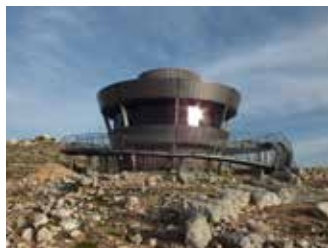
חמישי | 20 באוגוסט

סרט לילי באפרת / ט' באלול 24 באוגוסט המועצה המקומית והמרכז הקהילתי באפרת מזמינים את הילדים והמבוגרים להקרנה לילית של סרטי קולנוע לכל המשפחה. לילדים יוקרן הסרט "סיפורו של דולפין 2" בשעה 19:30, ולנוער ולמבוגרים יוקרן הסרט "הבלתי אפשרי" בשעה 21:00. הכניסה חופשית. מומלץ להביא מחצלות ושמיכות.