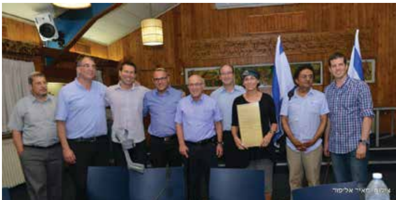
איש ציבור ואנשי תקשורת רבים חתמו השבוע על אמנה ישראלית לחיים משותפים ולהקעת האלימות בישראל. בזממת העמותה לאחדות ישראל, לזכר שלושת הנערים.

למרבה הצער, ביממה האחרונה אירעו שני מעשים מזעזעים ומתועבים של רצח וניסיון לרצח. אדם הלך, כביכול, בשם התורה והטורה והקדושה, לבער את הטומאה, וזאת על ידי מעשה שהוא הנורא מכל, והוא עצמו אבי אבות הטומאה - רצח בזדון. ברוך ה' שזממו המתועב לא יצא אל הפועל במילואו, ונקווה שכל הפצועים יחלימו במרהה וישבו לאיתנם. לצערנו במקרה השני של בני המשפחה הערבית, התינוק נרצח ובני משפחתו נפצעו קשה מאוד, ומי יודע עוד כמה יצטרכו להתייטר מפציעותיהם הקשות. עוד הוסיפו חטא על פשע, וכתבו שם: "חי המלך המשיח לעולם ועד". כאילו בשם השלום העולמי של ימות המשיח, צריך לרצוח אנשים בשנתם. האמת שבכל חברה יש פושעים, ונציגי החברה חייבים להתמודד איתם. לשם כך יש חוק ושלטון. אבל זה שהפושעים הללו מעיזים לעשות על עצמם מחלצות של קנאות לה' ולתורתו, מתאפשר מפני שציבורים גדולים, שומרי תורה ומצוות, ישרים ותמימים, חרדים ומתנחלים, חיים בתסכול עמוק וחוסר אונים. הם רואים באופן תדיר שהממשלה ומוסדות המדינה והתקשורת הממסדית, מפלה אותם ואת ערכיהם לרעה. התסכול הזה מתפרש אצל פושעים כמתן רשות לפעולות נוראות.