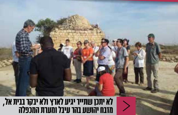
לא יתכן שתייר יגיע לארץ ולא יבקר בבית אל, מזבח יהושע בהר עיבל ומערת המכפלה

ראשית, כל התוכניות שאנו מציעים ללקוחותינו כוללות סיורים מובנים ביהודה ושומרון. לא יתכן שתייר יגיע לארץ ולא יבקר בבית אל, מזבח יהושע בהר עיבל ומערת המכפלה. רוב מוחלט של סוכני