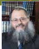
הרב שלמה לוי נשיא הגרעין התורני וראש ישיבת ההסדר בראשון לציון