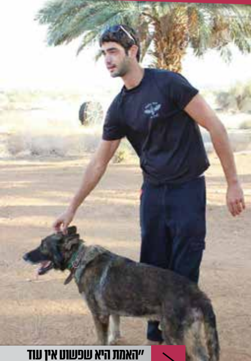
"האמת היא שפשוט אין עוד עסק כזה..."

בשיתוף המרכז לטיפוח ימות ועסקים קטנים ביהודה, שומרון והבקעה www.mati-shay.org.il