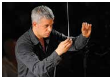
שלישי | 12 במאי