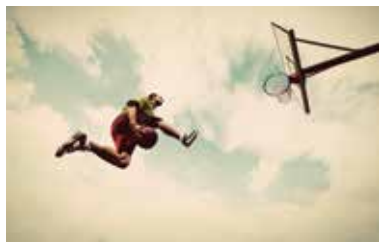
שלישי | 5 במאי

טורניר סטריטבול בנימין / ט"ז באייר 5 במאי כוכבי הפועל "בנק יהב" ירושלים בסטריטבול בנימין השני שייערך ביישוב עפרה! מחלקת הספורט של מנצ"ס בנימין מזמינה אתכם לקחת חלק בחוויית כדורסל יוצאת דופן - טורניר סטריטבול בנימין בכדורסל. בשיאו של האירוע יתקיים משחק ראווה חגיגי למען ילדי עמותת "לב בנימין" בהשתתפות יותם הלפרין, ליאור אליהו, דונטה סמית, ברייסי רייט ויתר כוכבי הפועל "בנק יהב" ירושלים. לפרטים והרשמה: sportbinyamin.co.il