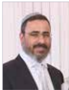
הרב בן ציון אלול ראש ישיבת בני"ע יתיבות חיים' פסגת זאב