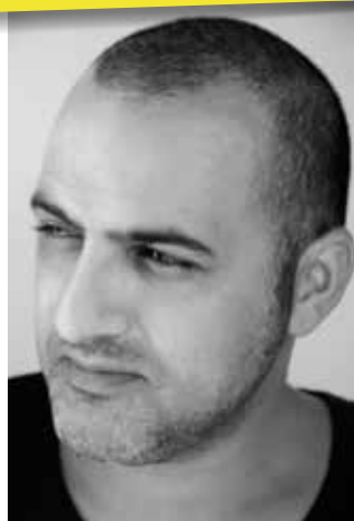
יום רביעי | 17 לדצמבר

יום עיון בנושא המבצע האחרון במרחב הרי יהודה, שהביא להרחבת פרוזדור ירושלים וכמעט פרץ את הדרך לגוש עציון ומזרח ירושלים. יום העיון, שיתקיים בבי"ס שדה כפר עציון יחל בשעה 9:00 ויכלול גם סיורים למעוניינים, הרצאות שונות וגילויים חדשים מאותה תקופה. לפרטים והרשמה: בי"ס שדה כפר עציון-02-9935133 או באתר הבי"ס.