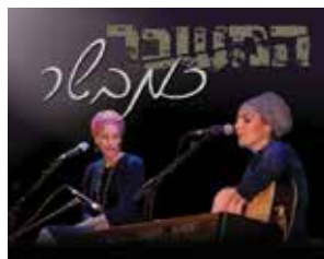
יום רביעי | 23 לדצמבר

הפסטיבל יתקיים בחבל מודיעין ובחבל בנימין, ויספר את סיפור המכבים בדרך חווייתית ומהנה, בעזרת שחקנים מחופשים שידריכו את המשפחות דרך העבר העשיר של האזור. גם יהיו: סדנאות יצירה, טיולי ג'יפים, פינות חי ומגוון הפעלות לכל המשפחה ברוח החג, כל זאת לצד הדלקות נרות חגיגיות במקום המשכן בשילה הקדומה, הדלקת נרות מוסיקלית עם חסידי הרב קרליבך במבוא מודיעים והדלקת נרות עם יוצאי חבאן במושב ברקת.