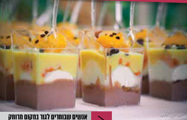
אנשים שבחורים לגור במקום מרוחק מקבלים את האפשרות להתפתח יותר

בשיתוף המרכז לשיפוח יזמות ועסקים קטנים ביהודה, שומרון והבקעה www.mafli-shay.org.il