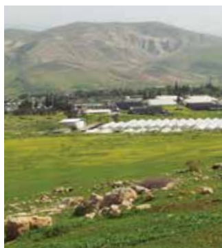
יום חמישי | 4 לדצמבר