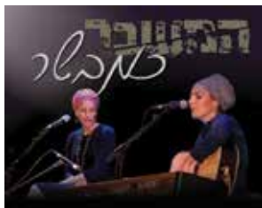
יום ראשון | 23 לנובמבר