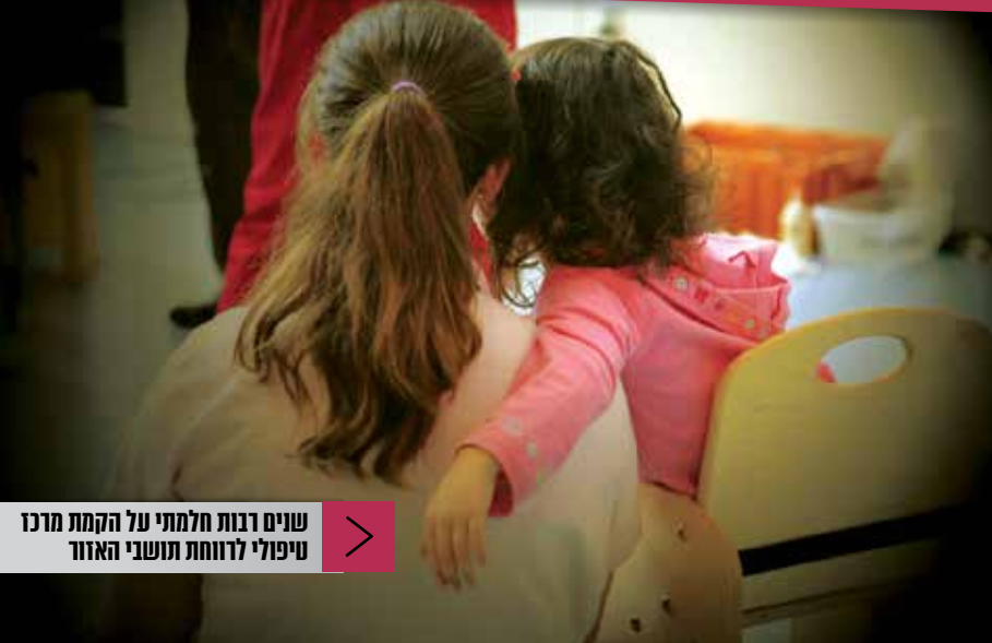
שנים רבות חלמתי על הקמת מרכז טיפולי לרווחת תושבי האזור

"המרכז נועד לענות על קשיים התפתחותיים רגשיים ולימודיים שעמם מתמודדים ילדים בגיל הרך ובבית הספר. בין השירותים שאנחנו מעניקים במרכז: אבחונים פסיכולוגיים, טיפולים רגשיים, הוראת מתקנת, קלינאות תקשורת, ריפוי בעיסוק, פיזיותרפיה, טיפול זוגי ומשפחתי, טיפול בהבעה ויצירה. הצוות שלנו עובד בשיתוף פעולה מלא, על מנת לקדם את הילד, והוא נבחר בקפידה ומורכב ממומחים בתחום. בניגוד למקומות ציבוריים, התורים אצלנו קצרים יותר ואנחנו מוכרים כמובן ע"י קופות החולים".