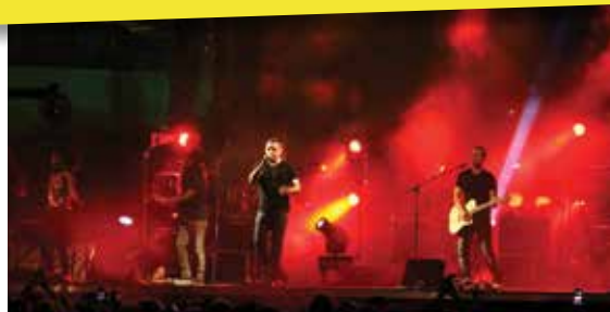
יום רביעי 17 בספטמבר

להקת אתניקס, עם הלהיטים "תותים", "מחר אני בבית", "ג'סיקה", "ציפור מדבר" ואחרים חוגגת 30 שנה בהופעה בשערי תקווה וקוראת לקהל להצטרף. "שמחים לבוא להופיע בשומרון, מזמינים את כולם לבוא ליהנות אתנו!", נמסר מהלהקה. את האירוע יכבדו בנוכחותם יו"ר הכנסת ח"כ יולי אדלשטיין וח"כ איילת שקד.