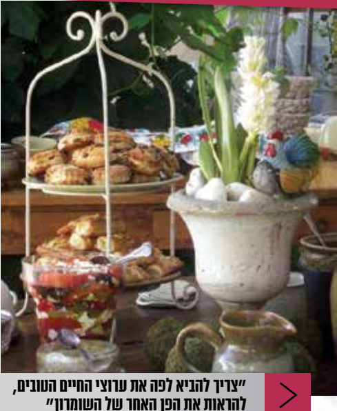
"צריך להביא לפה את ערוצי החיים הטובים, להראות את הפן האחר של השומרון"