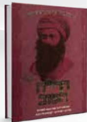
הרי"ח הטוב אבישי בר אושר

"הבן איש חי" - הרב יוסף חיים מבגדד זצוק"ל, אשר משנתו ופועליו מאירים ומשמשים דוגמא ומופת לאהבת ישראל, ארץ ישראל ותורת ישראל.