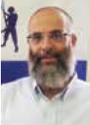
הרב יצחק נסים