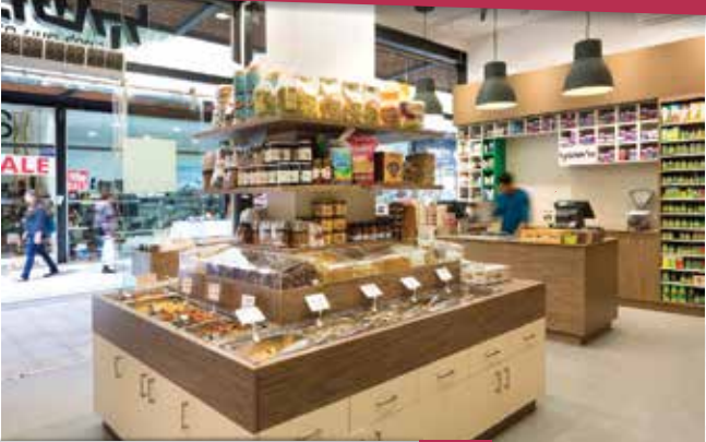
"הלקוחות שלנו כאן הם אנשים שאנו מחוברים אליהם מעבר לרמה העסקית נטו"