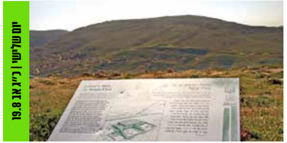
יום שלישי | כ"ג באב 19.8

קיץ אתגרי בפארק העשור באפרת | ט"ז בטב 11.8 מתנ"ס אפרת מזמין את הציבור לקיץ ספורטיבי בפארק העשור. בתכנית: תחרות בימבות, חישוקים, כדורים, מוסיקה ועוד. הכניסה חופשית. לפרטים: 02-9932936