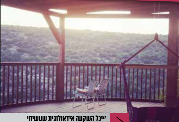
”כל השקעה אידאולוגית שעשיתי בסוף יציאה ההשקעה הכי טובה”