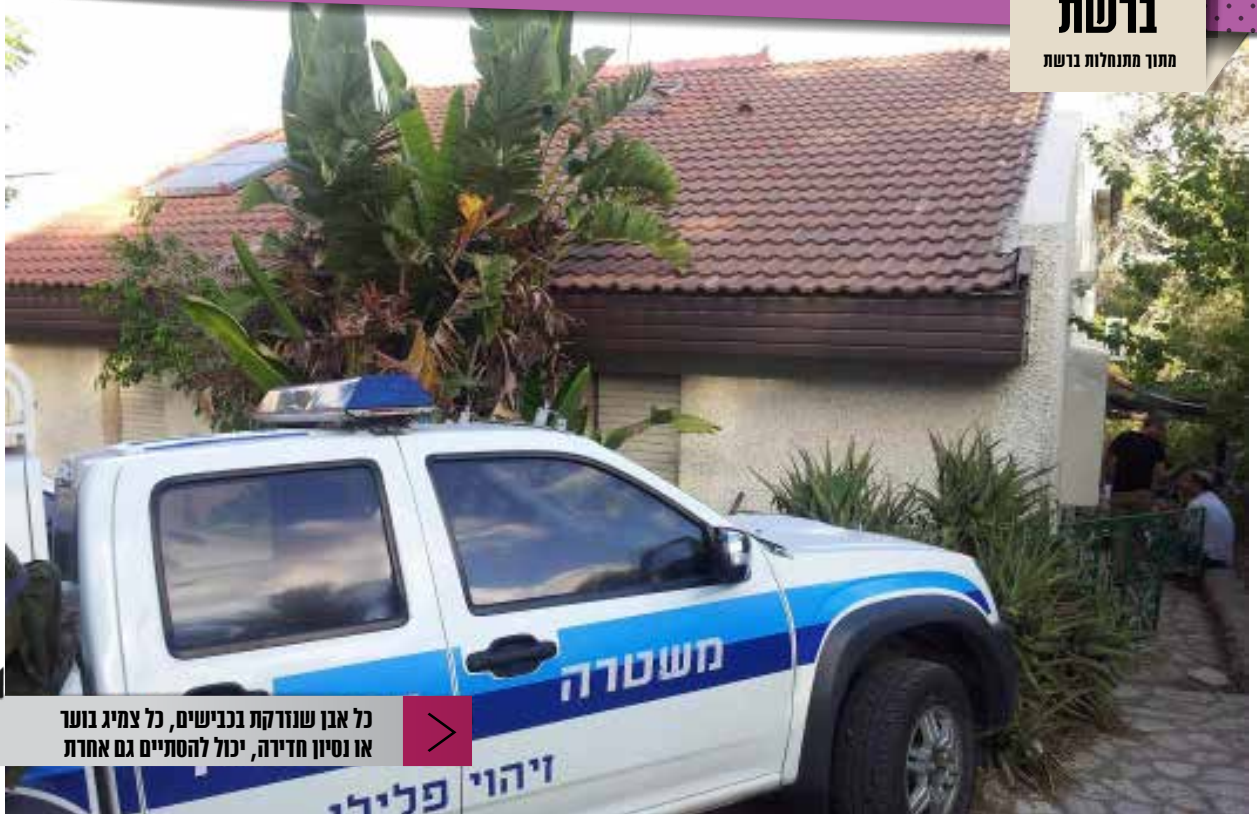
כל אבן שנזרקה בכנישים, כל צמיג בוטר או נסיון חדירה, יכול להסתיים גם אחרת