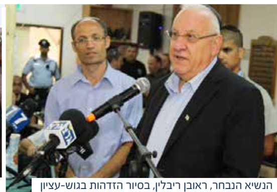
הנשיא הנבחר, ראובן ריבלין, בסיוור הזדהות בגוש-עציון