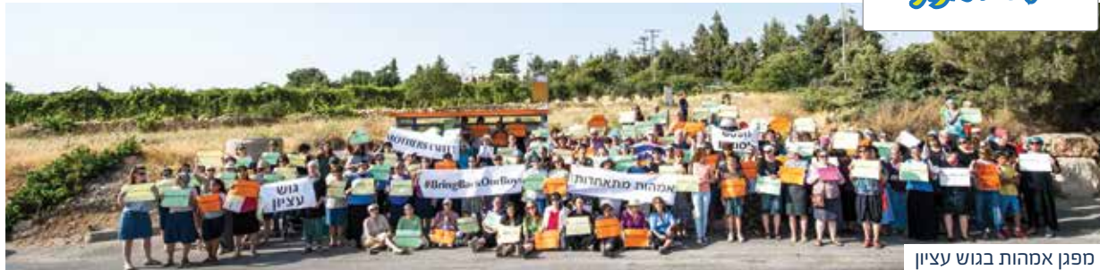
מפגן אמהות בגוש עציון