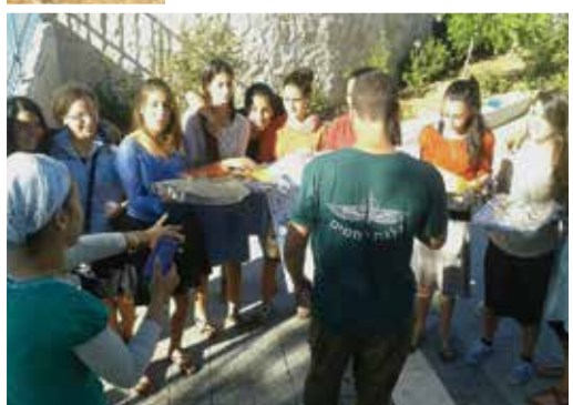
קרית ארבע הקימה מערך התנדבות לטובת החיילים