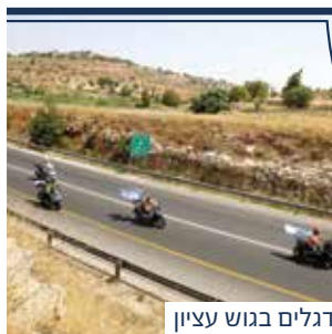
שירת אופנועים ודגלים בגוש עציון