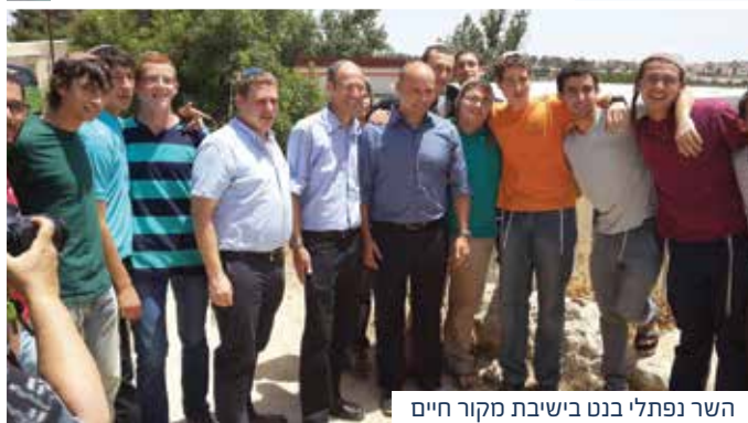
השר נפתלי בנט בישיבת מקור חיים