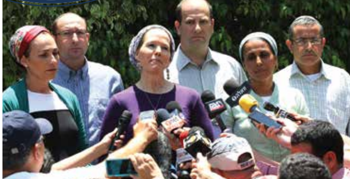
הורי הנערים החטופים במפגן של עוצמה לא רגילה לעיני העולם כולו