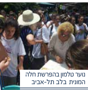
נוער טלמון בהפרשת חלה המונית בלב תל-אביב