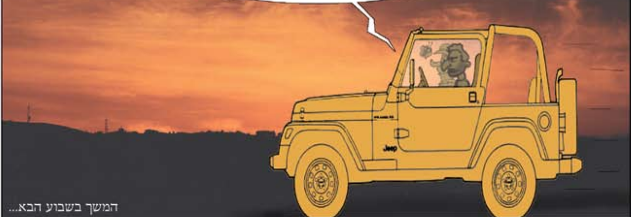
המשך בשבוע הבא...

טוב, אנחנו נוסעים עכשיו לסוסיא ואחרי זה - אם עוד פעם אחת נגיע למקום מיותר שלא מקרב אותנו לאוצר - זה הסוף שלכם!