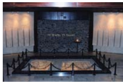
החזיון האור קולי בכפר עציון

דוד בן גוריון - ראש הממשלה ושר הביטחון דאז אמר על הלוחמים: "איני יודע מערכה יותר מפוארת, טראגית והרואית בכל מלחמות הגבורה של צבא הגנה לישראל - מהמערכה בגוש עציון... מפעל הקרבנות הציל את ירושלים יותר מאשר כל המאמץ המלחמתי... מערכת גוש עציון זה האפוס הגדול נורא ההוד של מלחמת היהודים... אם קיימת ירושלים עברית...אזי התודה הראשונה