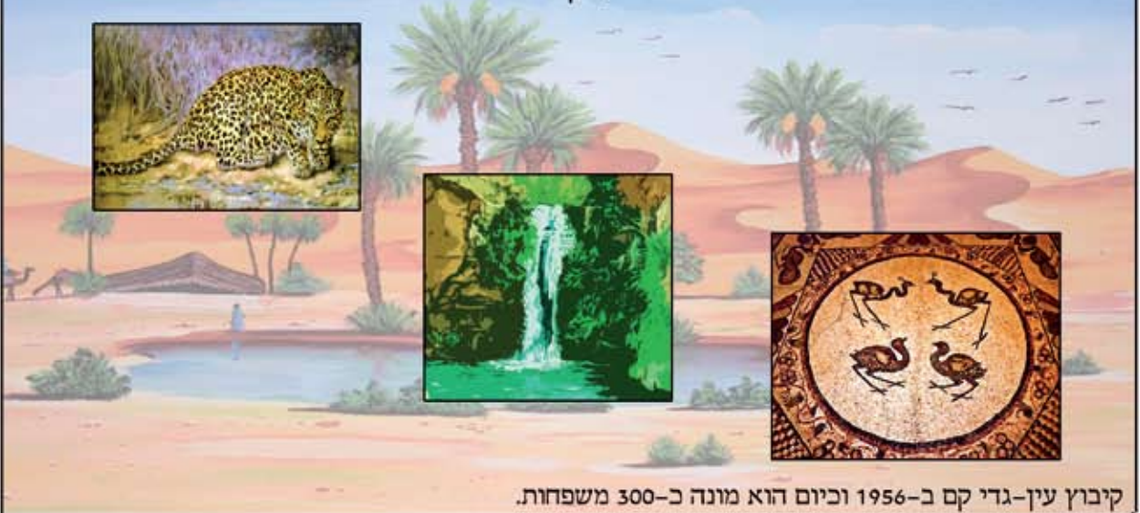
קיבוץ עין-גדי קם ב-1956 וכיום הוא מונה כ-300 משפחות.

עין-גדי הוא שמם של מעיין, שמורת טבע ועיר עתיקה השוכנים לחופו המערבי של ים המלח, בתחומי מדבר-יהודה, כחצי קילומטר צפונית לקיבוץ עין גדי. השם עין גדי נזכר בתנ"ך - במצודות עין גדי הסתתר דוד כאשר ברח משאול (שמואל א') והיישוב אף מוזכר בספר יחזקאל, בשיר השירים ובספר דברי הימים א'. שמורת עין גדי היא נווה המדבר הגדול בארץ ובתחומה 2 נחלים - 'נחל דוד' ו'נחל ערוגות'. בתחומי השמורה מצויים גם מערות, מעיינות, בריכות, מפל ובעלי חיים רבים. בשנת 1965 נחשפו ליד השמורה שרידי בית כנסת עתיק מהמאה ה-3.