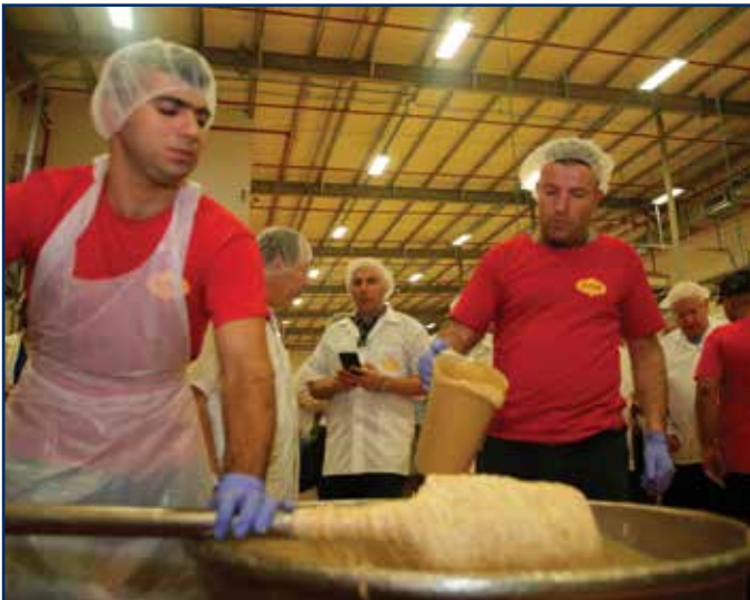
עובדי מפעל "אחוזה" באזור התעשייה אריאל המופיע ברשימה השחורה של האו"ם

השבוע פירסם האו"ם את הרשימה השחורה, אותה רשימה של עסקים ותאגידים מהארץ ומחו"ל, אשר פועלים ביהודה, שומרון ובקעת הירדן או שיש להם סניפים באזור. זהו חלק ממאמצי החרם הבינלאומי וה-BDS, אשר עובדים ימים ולילות כדי להכפיש את שמנו בעולם. ברשימה נמצאות חברות מוכרות יותר ומוכרות פחות, אבל דבר אחד משותף להן - הן תומכות בכלכלה, בתעשייה ובחקלאות ביהודה, שומרון, בקעת הירדן ורמת הגולן.