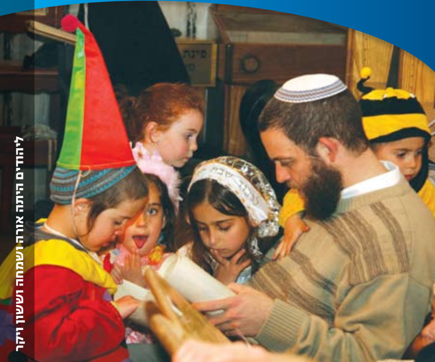
ליהודים הייתה אורה ושמחה וששון ויקר